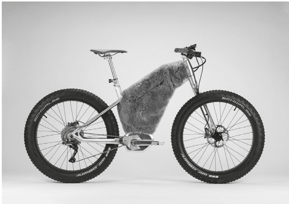
Starckbike M.A.S.S. Snow, 2012 © Starck Network

Concebida como una «máquina de energía», esta exposición del Centre Pompidou Málaga pretende conducir a los visitantes al imaginario de Starck y al corazón de su proceso creativo, a través de la inmersión en miles de sus dibujos, croquis e investigaciones. Un viaje por la creación que reúne toda suerte de objetos, del más icónico al más cotidiano, un llamado a los espectadores a redescubrirse actores. Una exposición en forma de autopsia de un creador vivo a fin de explorar el inconsciente de la creación, esa «misteriosa sombra» que persigue a Starck.