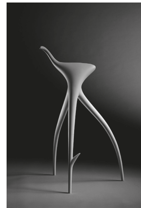
Taburete W.W. , 1988© Starck Network / Vitra International

las paredes con sus dibujos, transforma el espacio expositivo en un entorno cerebral, una suerte de gruta decorada que nos devuelve nuestros gestos primordiales y la dimensión ritual de la creación. Este «all-over» de dibujos es como un cuadro sin reglas prescritas, en cuya teatralidad Starck nos permite adivinar, sin desvelarlo enteramente, un «misterio» que vendría a ser el de la creación. Cada proyecto de Starck, en efecto, ofrece a la vez una multiplicidad de guiones y un montaje de escenas alegres, misteriosas, enigmáticas, llenas de incongruencias, juegos mentales y fértiles sorpresas. La exposición del Centre Pompidou Málaga es una invitación al inconsciente de la creación, donde se manifiesta la «energía poética de los objetos de Starck.»