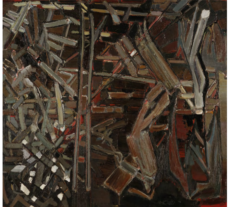
La Vie dure [1946]

Pierre Lecuire, Journal des années Staël , 29 de abril de 1947