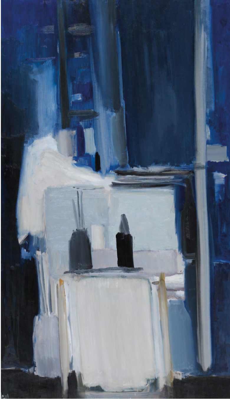
Coin d'atelier fond bleu , 1955