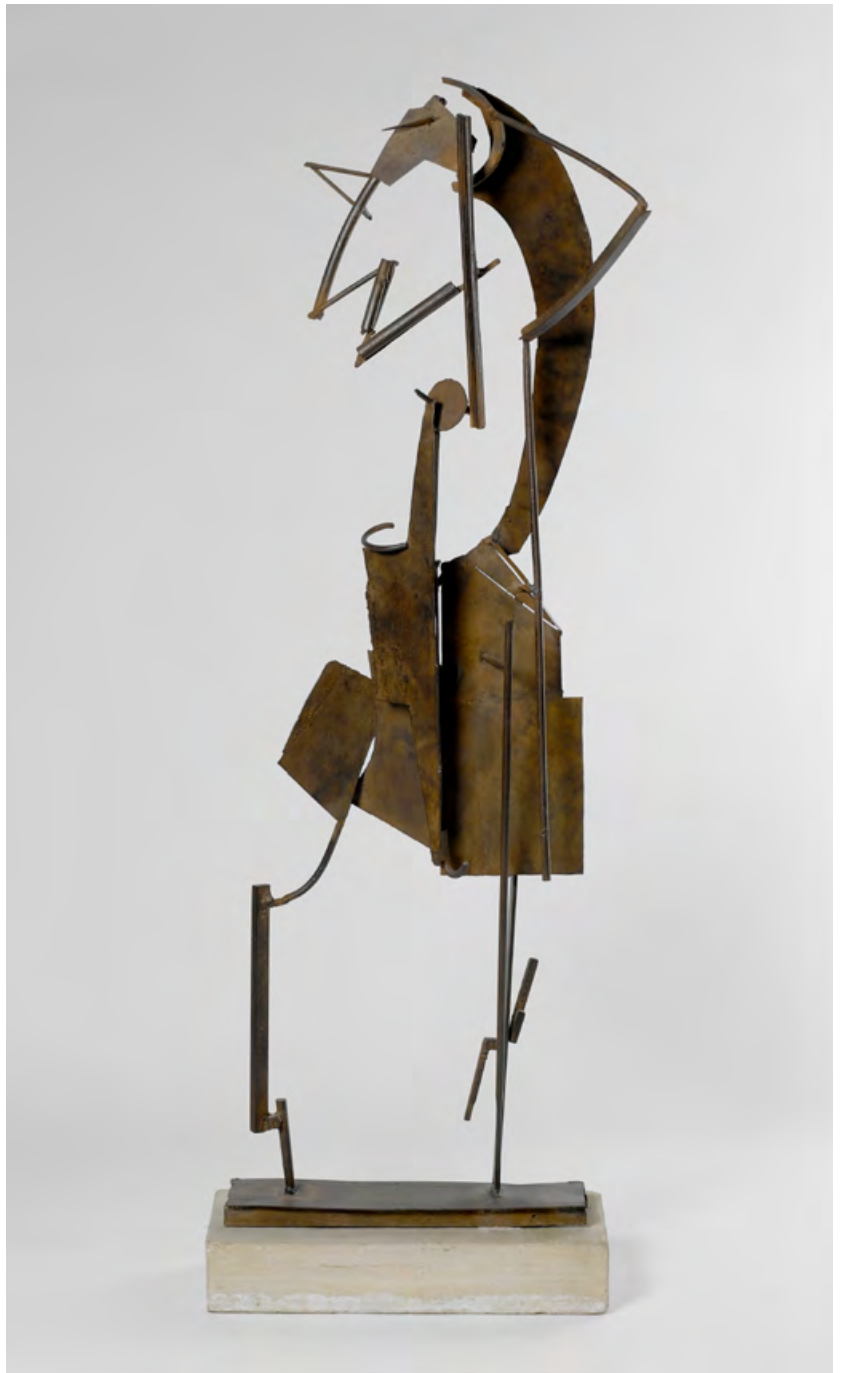
Mujer peinándose I [1931]. Hierro forjado y soldado. 168,5 × 54 × 27 cm.

Con la serie de esculturas lineales forjadas en los años 1930, González inventa un modo de expresión propio del metal. El uso de varillas de hierro forjado y soldado genera formas vaciadas, reducidas a patrones geométricos, a un «dibujo en el espacio». Este concepto, reforzado por su colaboración con Pablo Picasso entre 1928 y 1932, lo defiende en su ensayo «Picasso y las catedrales, Picasso como escultor» (1931-1932, archivos del Institut Valencià d'Art Modern). Toma forma en la escultura Femme se coiffant I [Mujer peinándose I] de 1931, cuya estructura esta sostenida sobre varillas con planos vacíos y planchas macizas que aseguran su volumetría.