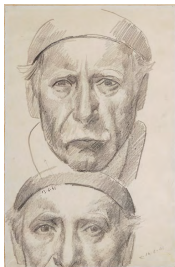
Dos autorretratos, 13-14 junio de 1941. Mina de grafito sobre papel. 31 × 20 cm.