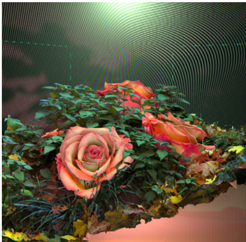
Sabrina Ratté, Floralia III , 2021. © Sabrina Ratté. Courtesy Galerie Charlot, Paris