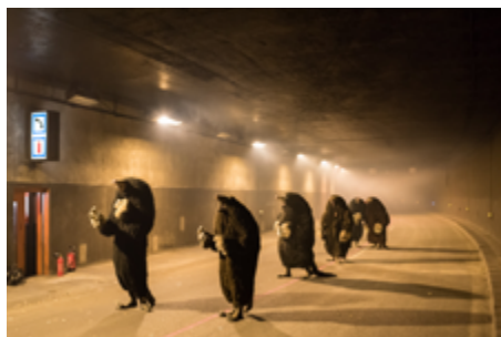
© Philippe Quesne. Foto: Martin Argyroglo

Nacido en 1970, Philippe Quesne, director de teatro y artista visual, vive y trabaja en París. En sus obras rastrea lo maravilloso, llevando al extremo las experiencias de la vida cotidiana y la relación entre el hombre y la naturaleza. Trabaja sobre pequeñas comunidades utópicas a las que presenta bajo el objetivo de un microscopio, como se hace con los insectos. La escenografía resulta inseparable de su escritura, ya que es el ecosistema en el que están inmersos sus intérpretes. Philippe Quesne también presenta performances e intervenciones en exposiciones, así como en el espacio público y en sitios naturales. Desde 2014 hasta enero de 2021, fue director de Nanterre-Amandiers, Centro dramático nacional en las afueras de París. En el 2003 fundó su compañía Vivarium Studio con la que trabaja hasta la fecha.